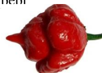
Trinidad Scorpion Butch T