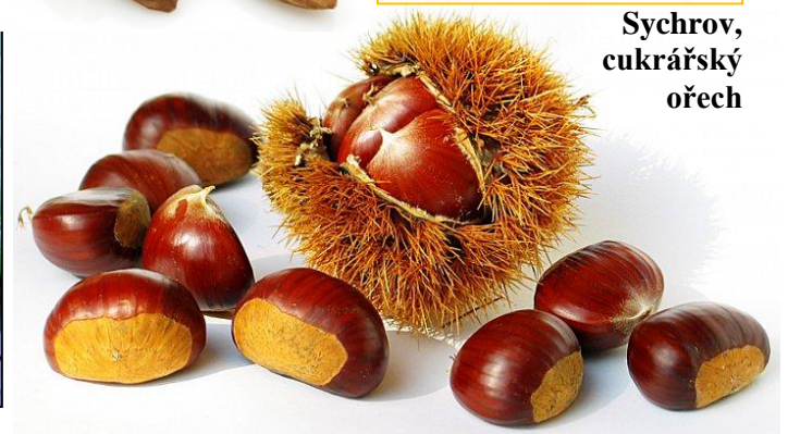
Sychrov, cukrářský ořech