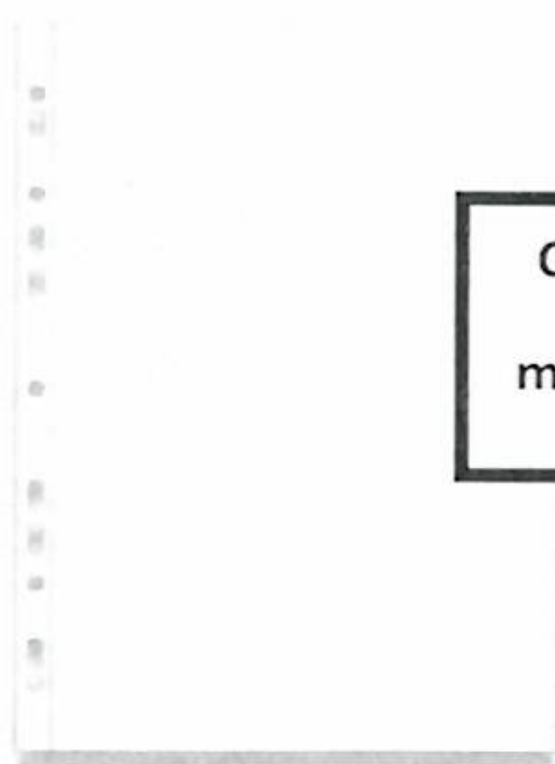
OA Maxi - zakládací obal matný nebo transparentní

budou mít žáci minimálně 10 průhledných obalů na písemnosti velikosti A4